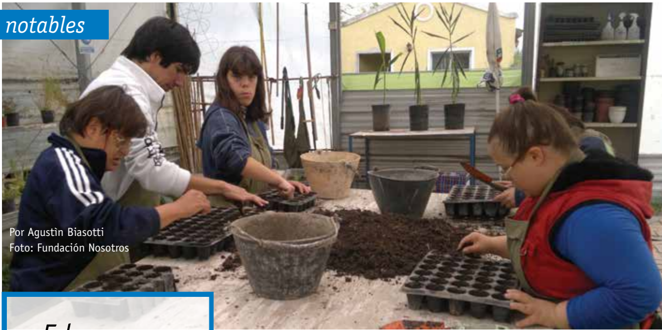
Por Agustín Biasotti