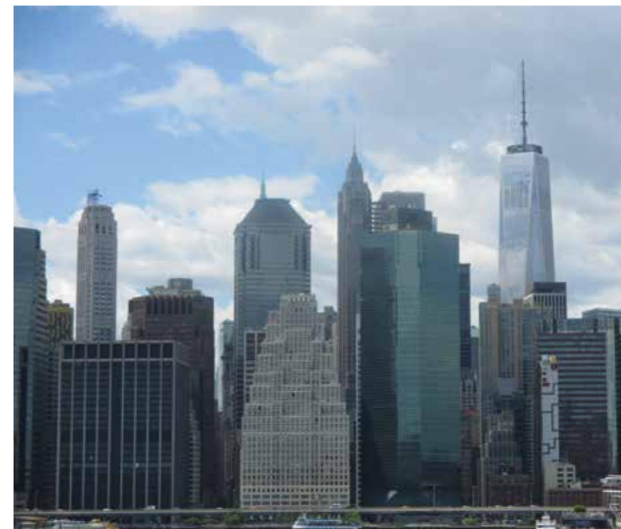
Arriba: Lower East Side. Bajo estas líneas: el skyline. Derecha arriba: Central Park. Derecha abajo: El Highline en Chelsea.

Metropolitan Museum of Art todos los días el precio es a voluntad Museum of Modern Art entrada gratis todos los viernes desde las 6 pm Frick Collection, los domingos de 11 am a 1 pm el precio es a voluntad.